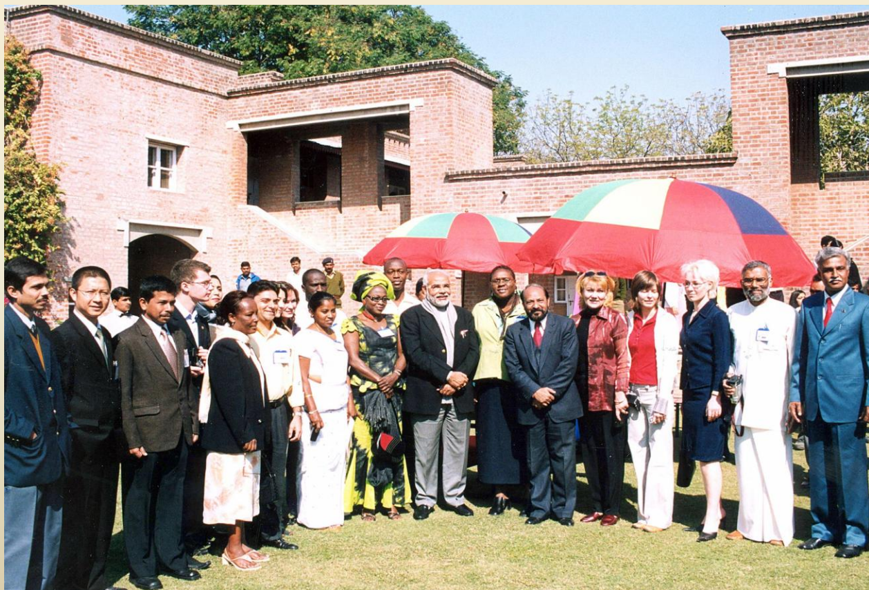
Participantes del Programa 2005-2006 con Shri Narendra Modi, en aquel entonces jefe de gobierno de Gujarat, y en la actualidad primer ministro de la India.

El Programa ITEC ha sido diseñado esencialmente como un programa bilateral . Aun así, en los últimos años los recursos del ITEC han sido utilizados además para programas de cooperación regional e interregional, tales como la Comisión Económica para África, la Unidad de Desarrollo Industrial de la Secretaría del Commonwealth, el G-77 y el G15. Recientemente, el ITEC también se ha involucrado con organizaciones regionales y multilaterales y grupos de cooperación como la Asociación de Naciones del Sudeste Asiático (ANSA), la Iniciativa de la Bahía de Bengala para la cooperación económica y técnica multisectorial (BIMSTEC), la Cooperación Mekong-Ganges (en inglés "Mekong-Ganga Cooperation" o "MGC"), la Unión Africana (UA), la Organización Afro-asiática para el Desarrollo Rural (en inglés "Afro-Asian Rural Development Organization" o "AARDO"), el Parlamento Panafricano, la Comunidad del Caribe (CARICOM), la Organización Mundial del Comercio (OMC), la Organización del Océano Índico para la Cooperación Regional (en inglés "Indian Ocean Rim — Association for Regional Cooperation" o "IOR-ARC") y el Foro de la Cumbre Indo africana.